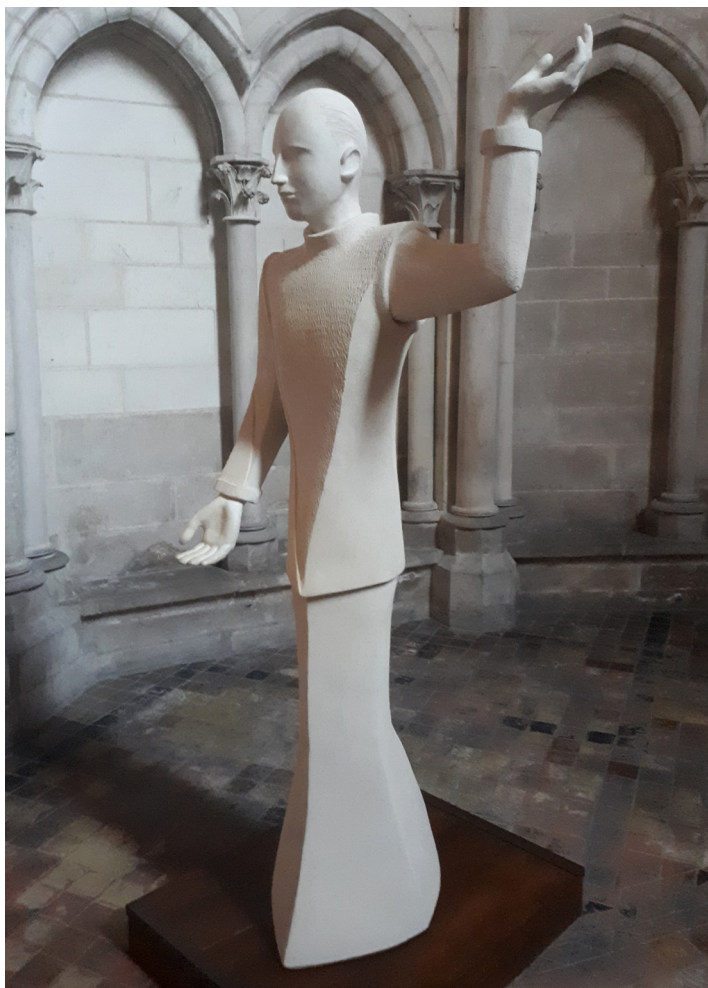
Sculpture de Christiane Boone, cathédrale de Troyes.

À lire dimanche prochain [23 août 1942], sans commentaire. ■