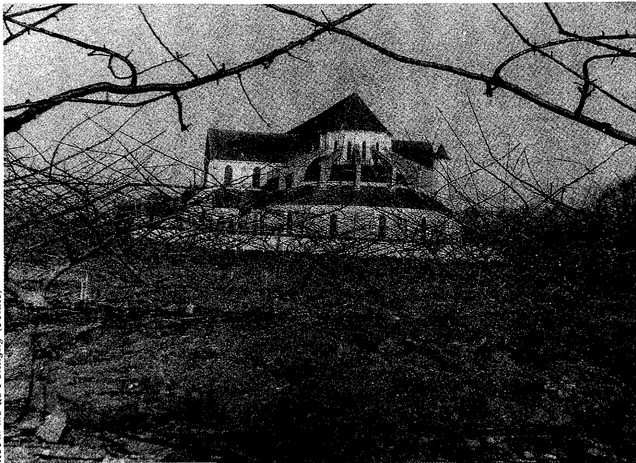
En attente du printemps