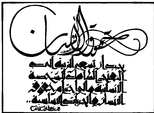
Déclaration universelle des Droits de l'Homme Article 27 calligraphié par Hassan Massoudy - 1988/1989

Si l'ambiance était loin d'être celle d'une journée de fête, les palestiniens l'ont vécue avec réalisme, estimant que l'essentiel a été réalisé : c'est le fruit des luttes et des souffrances. On déplore 380 tués pendant ces 11 mois d'Intifada. On ne se fait pas d'illusion. La route sera encore longue. On n'a peut être pas encore vécu le pire, cependant l'espérance et la détermination sont grandes ».